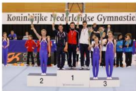
Redactie: Gerard Heughebaert maandag 12 juni 2016 08:28

ALPHEN AAN DEN RIJN – RKDOS kan terugkijken op een topweekende. Bij de meerkampfinales en de toestelfinales pakte de vereniging uit Kampen maar liefst veertien podiumplaatsen.